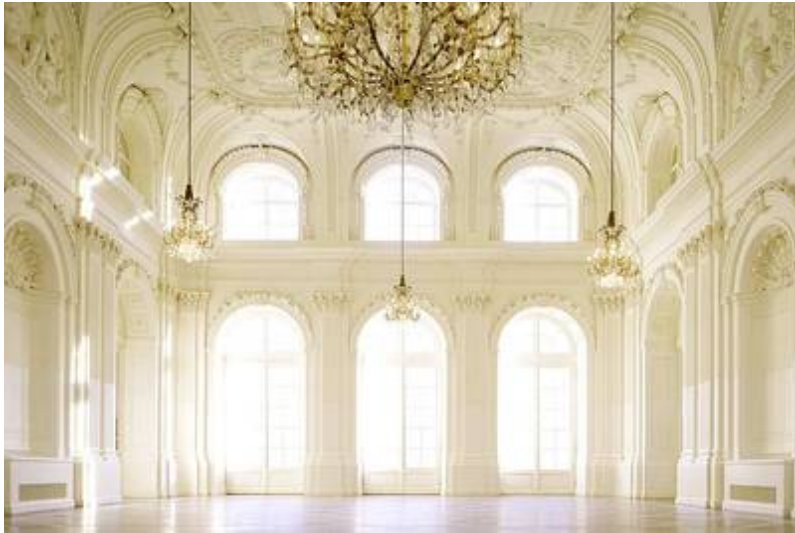
Locations Aachen / Altes Kurhaus / Altes Kurhaus - Ballsaal